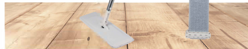
Швабра отжимная с телескопической ручкой DEKO DKFM07